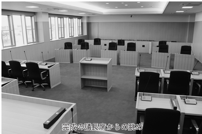
完成の議長席からの眺め