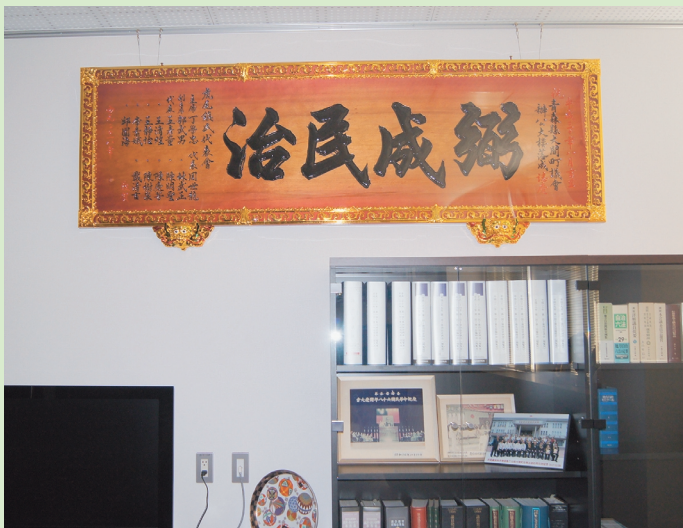
議員控室の壁に飾られた「彌成民治」の扁額

●読み方 彌成民治(ひっせいみんじ) ●意味 報酬のためでなく、もくもくと民のために働く「美德」