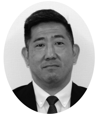
堀 祐介 議員 質問時間 45分