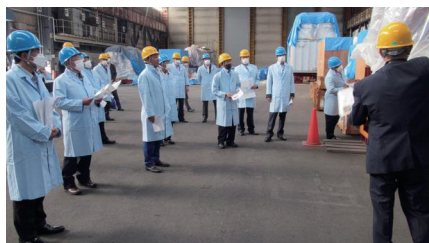
10/5 大間原発用タービン等視察(横浜市)