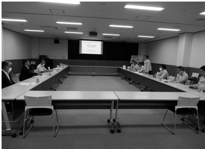
▼意見交換、質疑応答の様子

地 域 の 皆 様 も 電 源 開 発 株 式 会 社 が 開 催 す る 大 間 原 子 力 発 電 所 の 視 察 を と お し て、日 頃、感 じ て い る こ と を 直 接 お 尋 ね で き る 機 会 と し て 参 加 し て み て は い か が で し ょ う か。