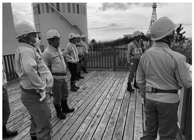
▲南側展望台視察の様子