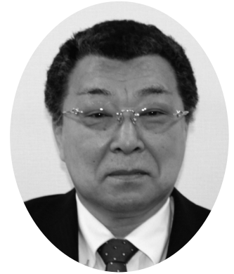
山崎 一利 議員 質問時間 30分