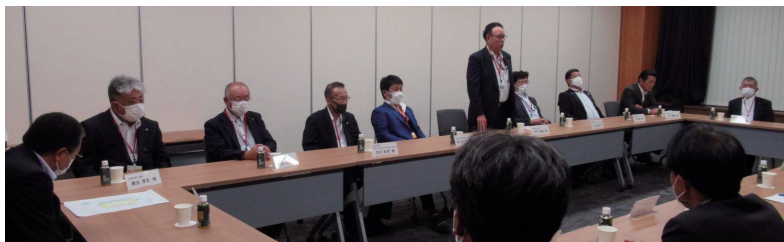
10/5 電源開発(株)本店表敬訪問(東京都)