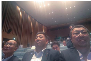
9/27 会場の様子 (参加者委員)