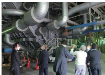
10/5 火力発電所視察(横浜市)