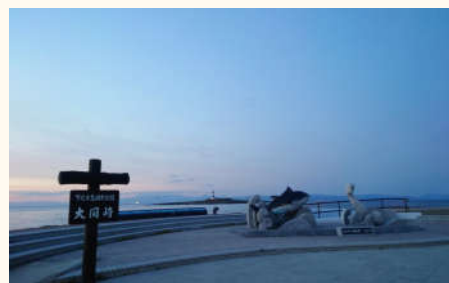
○大間崎まぐろモニュメント