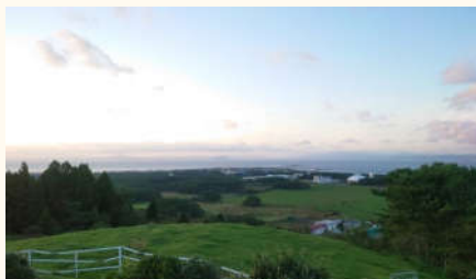
○展望台から見た大間牧场