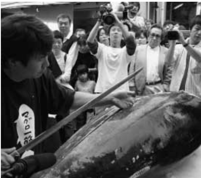
▲豪快にマグロをさばっていく職人。一つ一つの動作に歓声があがります

の登場を待ち構えていまし た。 築地の職人による鮮やか な包丁（刀？）さばきに よって解体されたマグロ は、2000食分の刺身へ と変わり、大間マグロのお いしさを口コミで広めても らうため、無料で配られ、 集まった人々の胃袋へと消 えていきました。