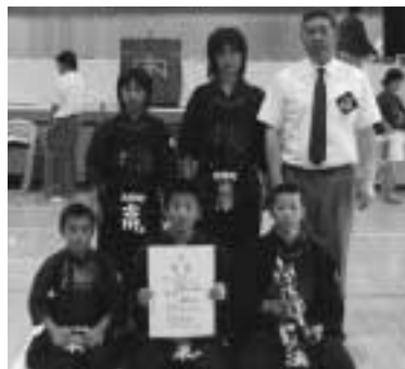
▶団体戦の優勝メンバー

剣道部は青森県スポーツ少年団フェスティバル、団体戦の部で優勝しました。三月に岡山県で行われる全国大会へ出場します。全国大会出場は五年連続で、今年こそは決勝トーナメントへの進出を目指し、これから更に練習に励むことになります。