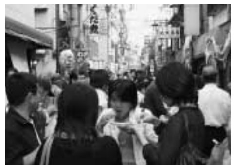
◀人でいっぱいになった会場