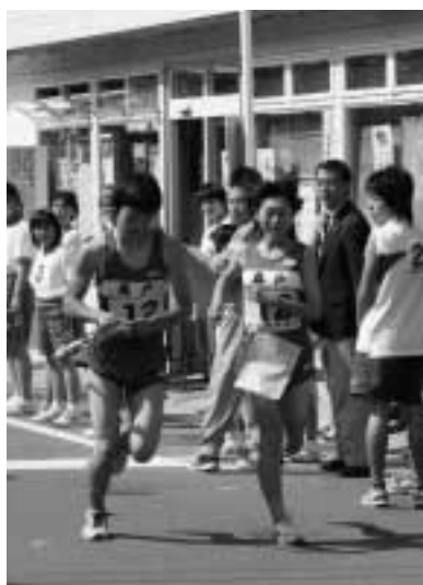
力走で見事1位となった奥中Aチーム