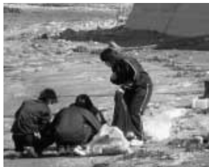
▲低気圧の影響でゴミが寄った海岸線

大間高校では、10月13日（金）の午前中 6地域に分かれて清掃活動を行いました。 10月8日の低気圧による影響で、海岸線は、大量のごみがあり、材木・奥戸間の国道でもゴミ袋20袋分の空き缶等が片付けられました。