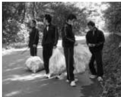
▲瞬間にかなりの量が