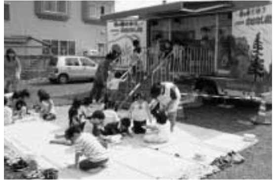
▲本がいっぱい！ワクワク、ドキドキ

9月19日（火）、全国各地の幼稚園、保育園や小学校、公民館などをキャラバンカーでまわり読み聞かせを行っている「おはなし隊」が大間保育園を訪れました。 園児たちは、絵本や紙芝居の読み聞かせを楽しんだり、キャラバンカーに展示してある約500冊の児童書から好きな本を自由に選んで実際に手にとって読んだりと、たくさんのお絵本とふれあうことができました。