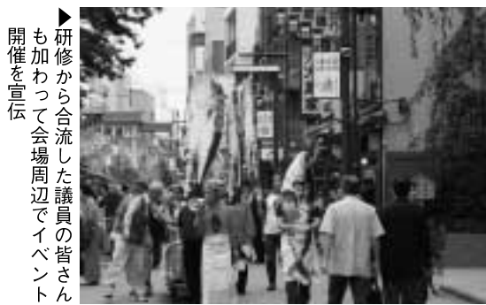
▶研修から合流した議員の皆さん も加わって会場周辺でイベント 開催を宣伝

9月30日（土）、浅草寺 への参拝客で賑わう仲見世 通りから程近い雷門柳町小 路通りの居酒屋風レストラ ン「魚菜（UOSAI）」 前において、大間活性化委 員会（やると会）主催によ る『大間マグロ解体ショー 』が行われました。