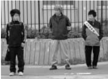
▶朝の挨拶運動で街頭に立つ声かけリーダーと町内会の方々