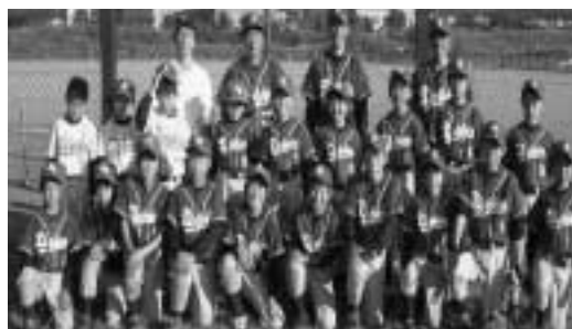
県大会で1回戦を勝ち意気が上がる子どもたち

野球部は九月に行われた新人戦のむつ下北地区予選で、全試合を投打に圧勝して優勝しました。