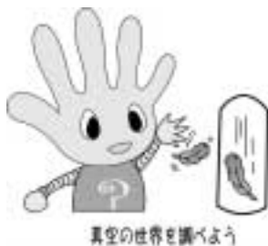
真空の世界を調べよう

…空気がない世界を考えてみたことはありますか？ふくらませた風船はどうなるんだろう？音は聞こえるのかな？空気がない、真空の世界を見てみませんか。