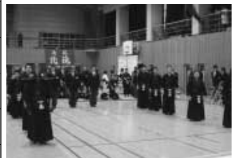
▲男子団体戦決勝は大間中同士