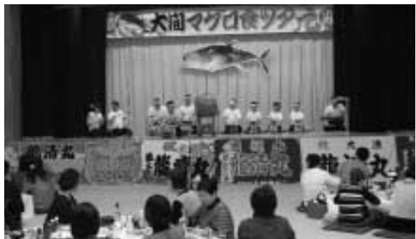
▶ 歓迎の宴で、身も心もリフレッシュ

夕食は、もちろんマグロ尽くしの料理。 参加者は、稲荷丸の祭囃子や海鳴り太鼓を 見ながら、マグロの兜焼きやお刺身を堪能。 最後は、北通りソーラン会と「よつちよ れ」や「大間小唄」を皆で踊りました。