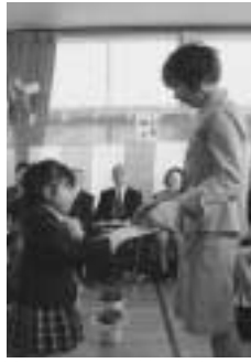
▲お母さんいつもありがとう