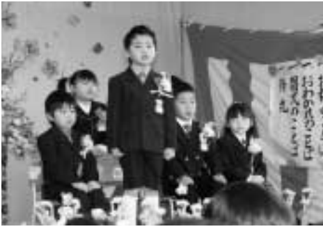
▲大きな声で夢を発表