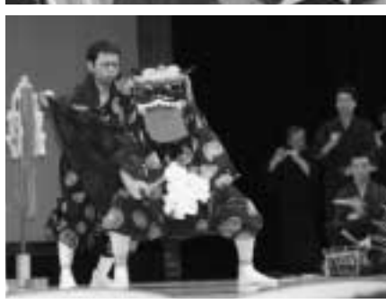
▶ 「矢越の神楽(平獅子)」