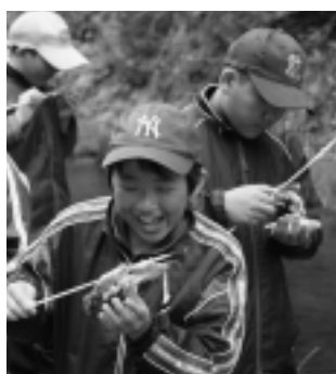
▶あっやばい落ちそう！