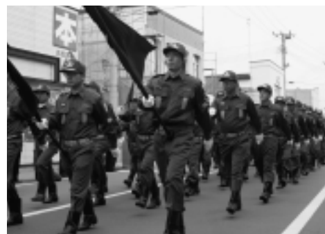
▶威風堂々とした分列行進