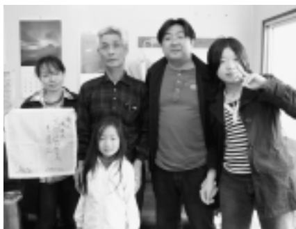
▲すっかり有名になった組合長とハイ、ポーズ