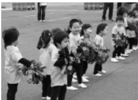
▶かわいらしく、火の用心をアピール