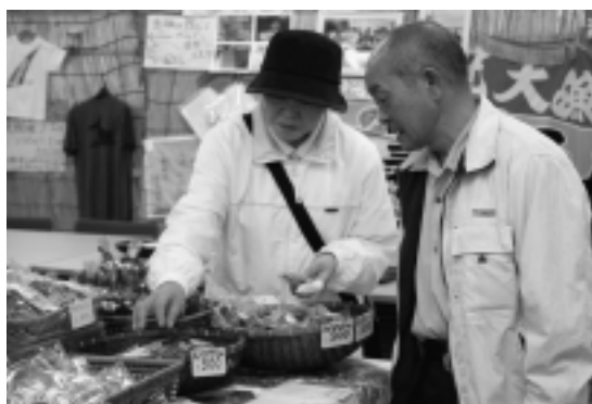
▶何をおみやげにしようか思案中