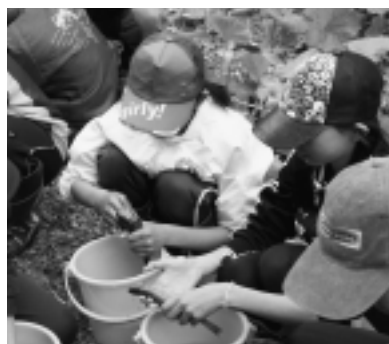
▶怖がっていたのは最初だけ

稚魚を放流して成魚を食べるといった、一見すると矛盾した体験を通じて、「おいしい魚を食べるためには、自然環境を守り、魚などの資源は食べる量だけとり、乱獲をしないことが大切」ということを学びました。