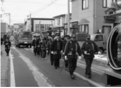
▶新年の空の下、パレードです