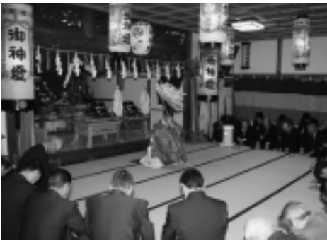
▶今年も良い年でありますように

最後に大間稲荷神社太神楽会による神楽舞いを奉納し、新年の海上安全と豊漁が祈願されました。