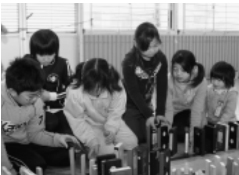
▶仲良く倒さないようドミノ牌を並べます

いよく倒れ、「お」「こ」「つ」「ぺ」「小」「学」「校」の文字と「ピースマーク」「花火」の模様が見事に浮かび上がりました。