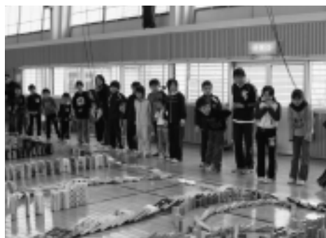
▶みんなの念力も加わり、つぎつぎ倒れていきます

12月20日(木)奥戸小学校において、児童会と6年生が中心となり企画された「91人でスーパードミノに挑戦」が行われました。