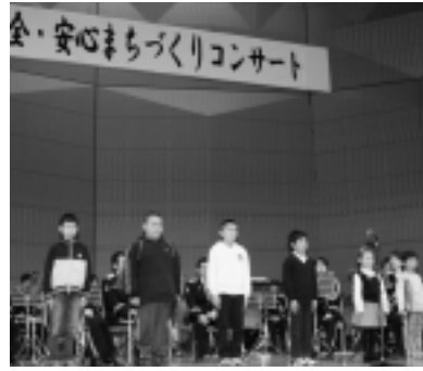
▶園児、児童による交通安全宣言

3月11日(火)北通り総合文化センター「ウイング」で、青森県警察音楽隊による演奏会が行われました。