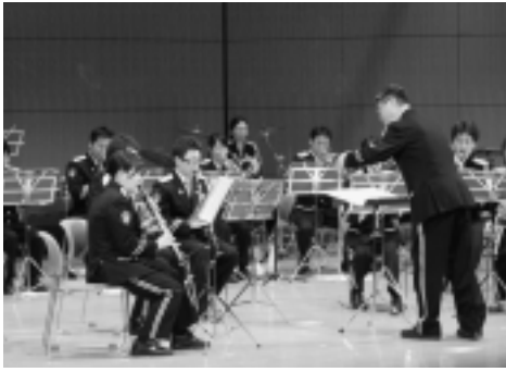
▶民謡や歌謡曲も聞かせてくれました。