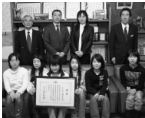
▲卒業直前にもらった大きなプレゼント

「会場がすごく立派で広かった。」「受賞記念で演奏した学校の演奏がすばらしかった。」など、忘れられない貴重な体験について、嬉しそうに語ってくれました。