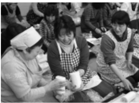
▶包丁を入れたら、お隣との品評会。