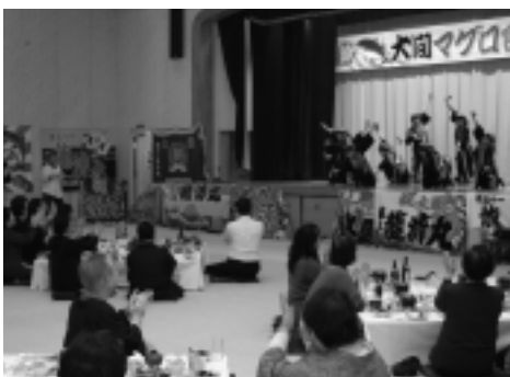
▶太鼓を叩いたり、踊ったり、大盛りあがりの会場。

2日目は、こすもす生活改善グループの指導のもと、ベコもち作りに挑み、悪戦苦闘しながらも、最後