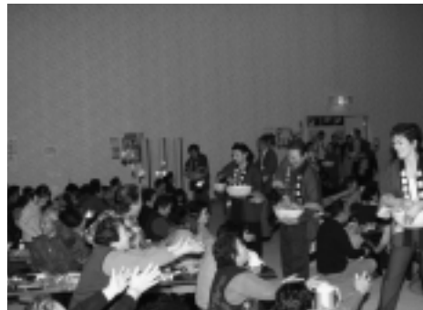
▲最後は恒例の餅まき(2/17)