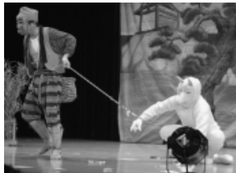
▶「キツネ踊り」佐井村(3/2)