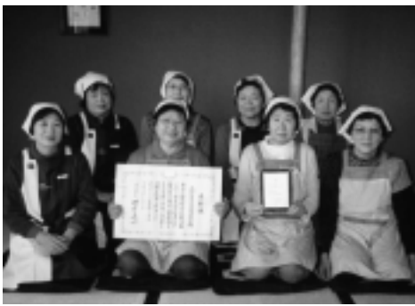
▶食改メンバーだけに「はいチーズ」

協議会では、これまで健診結果説明会の際に減塩料理のPRを行ったり、3歳児健診で、おやつを試食をふるまい虫歯になりにくいおやつについての講話をし