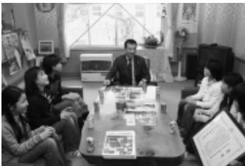
▶町長への報告では、「東京の人の多さにびっくり。」と本音も