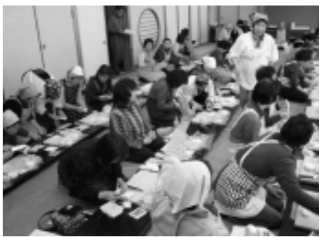
▶あちこちから、質問の音が上がり講師は大忙しでした。