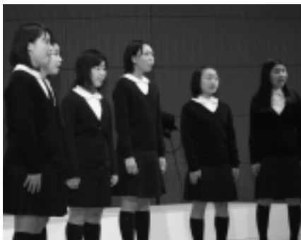
▶日本一に輝いた歌声を披露。

コンサートでは、受賞曲の「台風は考える」はもちろん、5年生有志らによる津軽海峡海鳴り太鼓の演奏や音楽部の皆さんによる合唱、練習の様子を再現した寸劇もあり、「ミニ」とは思えないコンサートに、拍手が鳴り止みませんでした。