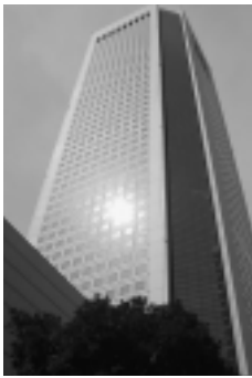
▶受賞式会場の東京オペラシティ