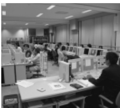
▶「パソコン活用講座の様子」

パソコンの基本的な操作から始まり、今年度は表計算ソフトの「エクセル」を使った表・グラフの作成、各種関数の使い方、さらにはデータベースまで盛りだくさんの内容でした。参加して下さいました二十七名の方々、本当にお疲れ様でした。