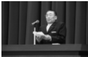
▲祝辞 (竹内町議会議長)