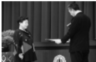
▲教育資金寄附者 母の会様