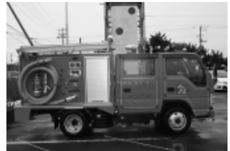
▲小型動力ポンプ付積載車