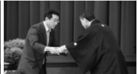
▲教材・備品 イトウスポーツ様