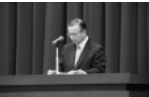
▲祝辞 (江渡聡徳様：代理)