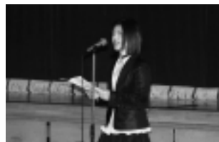
▲祝賀会：祝辞(島県教育委員)