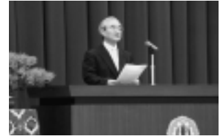
▲工事報告 (蛭子教育長)