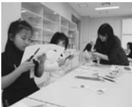
《おおぞら組による紙細工》