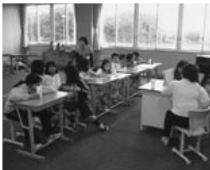
《読書サークルによる読み聞かせ》