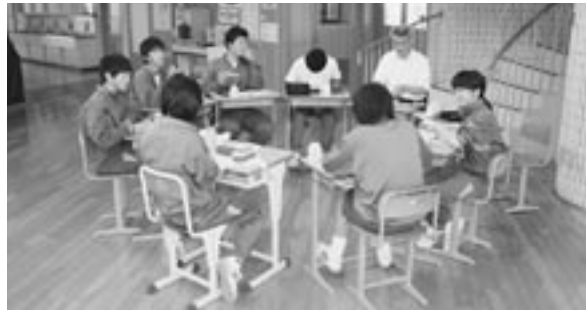
弁当の日の会食風景

作の弁当を作る。」ということ。初めは保護者の方々の協力も得ながら、三つのコースでだんだん自分で工夫しながら作ることにしています。