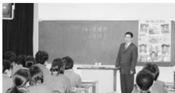
俣田先生の講演の様子

し、作ってくれた人の命で、こころの空腹感を満たす」というお話が心に残っています。