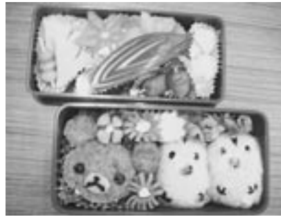
おいしそうな弁当