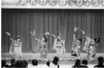
大間保育園音楽発表会(10/23)