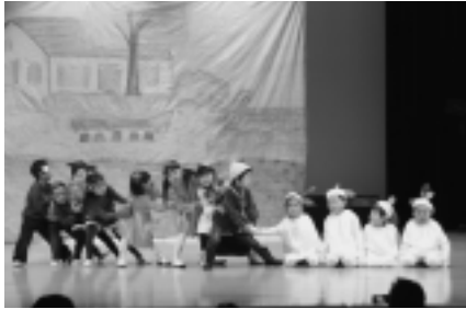
大間幼稚園発表会(10/23)