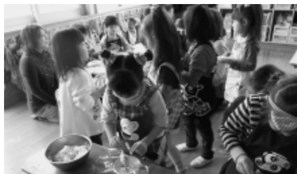
▶「今日はなにを入れてにぎろうかな?」