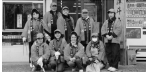
▶大間婦人部の皆さん