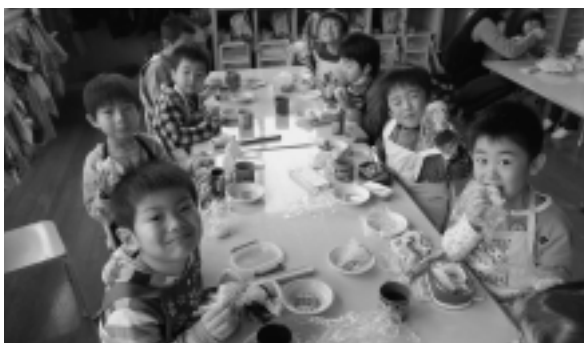
▶「ほっかほっかのおにぎりおいしいよ」