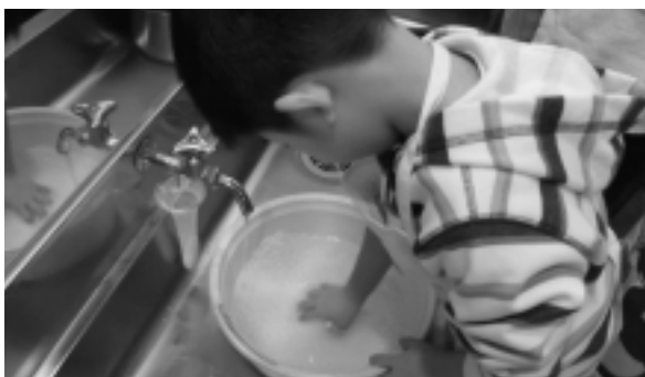
▶「あ!水をいれてといだら白くなったよ」