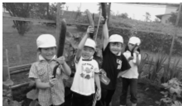
▶「でっかい きゅうりだよ!」「はやく たべたいね」