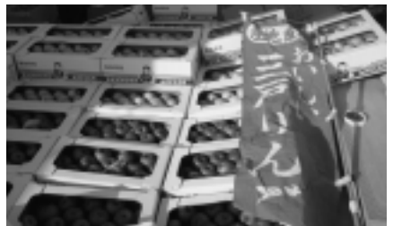
▲直送!三戸産りんご