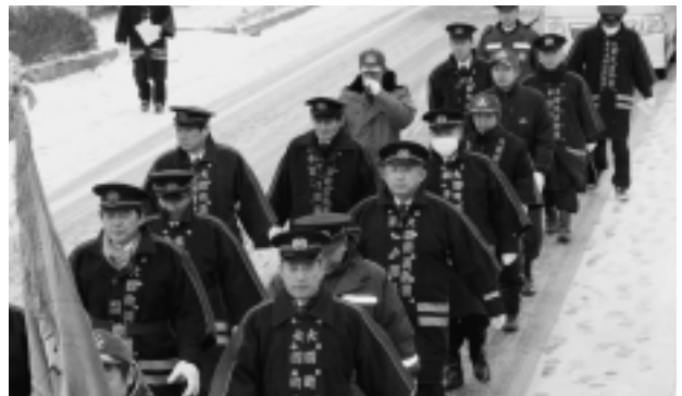
▲厳しい寒さの中での行進

1月5日(水)平成23年大間町消防団出初式が行われました。新年を迎え最初の演習となる出初式では、総勢112名の消防団員が大間、奥戸、材木それぞれの地区に分かれて行進が行われました。