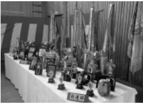
写真 卒業生活躍の足跡

金澤大間町長をはじめとして多くの来賓の皆様のご参列を得て、厳肅な雰囲気の中、涙ぐむ表情にも晴れやかさを感じさせながら、平成二十二年卒業生男子