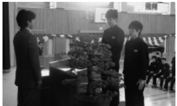
写真 同窓会入会式

昭和二十二年四月二十一日に開校して以来、今年度の卒業生を加え六六一七名が同窓会会員として名を連ねることとなりました。