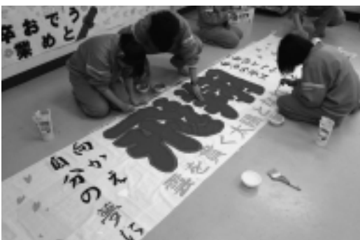
写真 卒業生を送る会