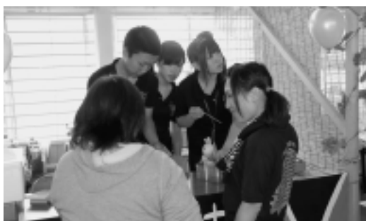
模擬店販売の様子

二日目は一般開放ということもあり、保護者や近隣の方々が多く来校してくださり、クラス展示やステージでの吹奏楽部の演奏会やバンド演奏・3年生による模擬店など、生徒の熱心な活動を見ていただきました。