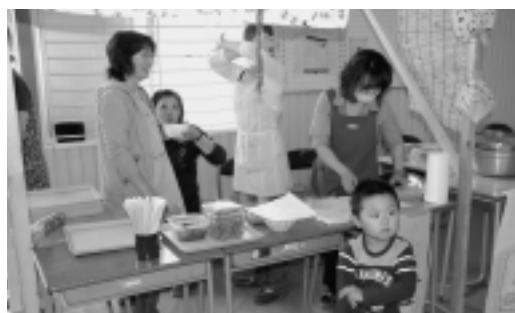
PTAのお母さん方の販売の様子

模擬店ではお好み焼き・たこ焼き・唐揚げ・焼き鳥・チュロス・チョコバナナなどが販売されました。また、今年もPTA母親委員会の協力でうどんとそばを調理・販売していただき、好評でした。お母さん方大変ありがとうございました。