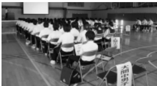
全体説明会の様子

7月31日(火)に中学生の大間高校体験入学が行われました。これは中学生・保護者の皆さん・中学校の進路担当の先生方に本校の教育内容や学校生活などの紹介を行い、今後の進路を考えていく上での参考にしてもらうために毎年行っている行事です。