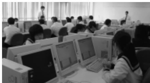
コンピュータ室での体験学習の様子

今年は生徒・保護者合わせて103名が参加しました。開校式の後、スライドによる学校紹介があり、質疑応答の後、体験学習A(国語・理科・英語・商業)と体験学習B(国語・社会・数学・商業)から2科目を選び学習しました。最後に班に分かれて校内見学・部活動見学・アンケート記入が行われ、終了しました。