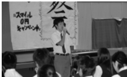
生徒会長のあいさつ

二日目は一般開放ということもあり、保護者や近隣の方々が多く来校してくださり、クラス展示やステージでの吹奏楽部の演奏会やバンド演奏・3年生による模擬店など、生徒の熱心な活動を見ていただきました。