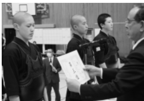
◀3人という少人数で大健闘した第3位の大間中学校男子