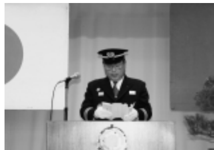
▲傳法団長による挨拶

その後、総合開発センターで行われた式典では、優良団員の表彰などが行われ、各団員が気持ちを引き締めて任務に励むことを誓いました。