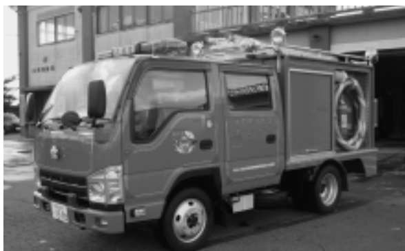
▲第7分団小型動力ポンプ付積載車

万が一の災害に備え、今後も計画的に整備し、大間町の消防力強化をはかっていきます。