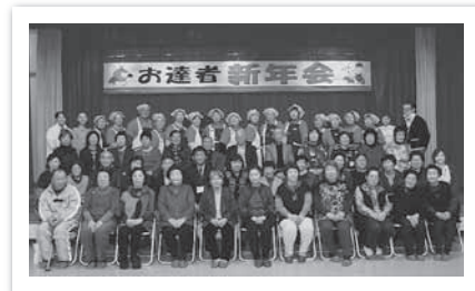
←一人暮らし高齢者新年会