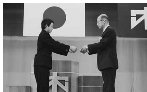
↑ 卒業生から学校へ記念品の贈呈 (合唱練習用CDプレーヤー：6台) 壁掛け用電波時計：6台)