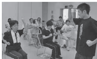
←健康運動指導士を講師に招いた健康教室