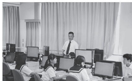
体験学習（情報処理）