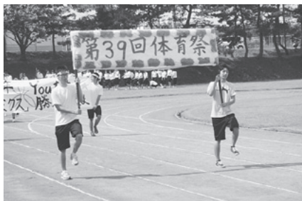
第39回体育祭（入場行進）

7月12日（土）台風8号が心配されましたが好天に恵まれ、第39回大間高校体育祭が開催されました。生徒会や各部活動の協力により準備から体育祭当日までスムーズに運営することが出来ました。なかでも応援パフォーマンスやクラス対抗リレーは大変な盛り上がりを見せ、特にクラス対抗リレーでは、最終的に全員が一つになり力を出し切り体育祭を成功に収めることができました。これは生徒会、体育祭実行委員会、その他大勢の生徒が一丸となって出来たことだと思います。10月に行われる大間高祭でも、全員が楽しく取り組み一丸となって成功させることを願っています。