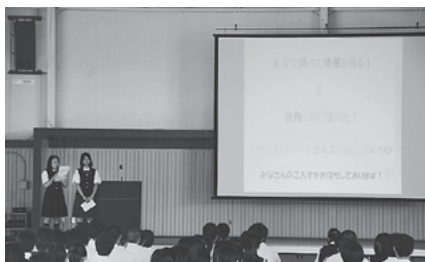
学校紹介（生徒会役員）

7月29日（火）中学生を対象とした大間高校体験入学が実施され、中学生・保護者合わせて99名の参加を頂きました。本校の学校紹介や教育内容、生徒会役員による学校行事や各種大会活動状況等を紹介しました。今年度は、夏季休業中の講習見学や体験学習として、実験や活動など体験できる内容を中心に計画いたしました。中学生は緊張しながらも興味・関心を持って臨んでおり、今後の進路の参考にさせていただきたいと思っています。また、今回の体験入学を参考に本校を希望することを願っています。