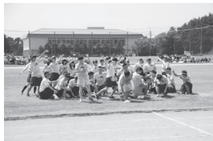
応援パフォーマンス（32HR）