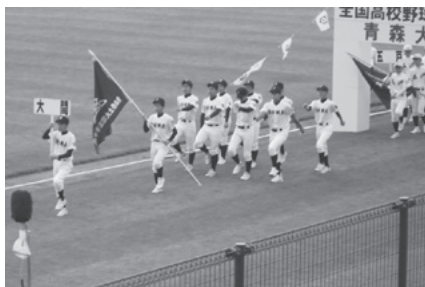
開会式（青森市営球場）