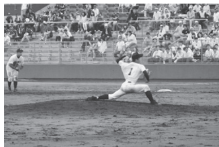
金木高校戦（宮川主将）