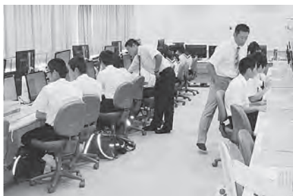
体験学習【情報処理】