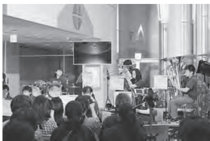
吹奏楽部【ちょぺこん演奏】