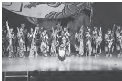
めんちょこ時代【公演会での応援】