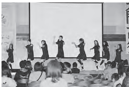
有志による発表【ダンス】