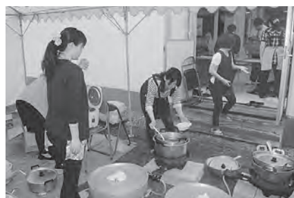
母親委員会【カレー販売】