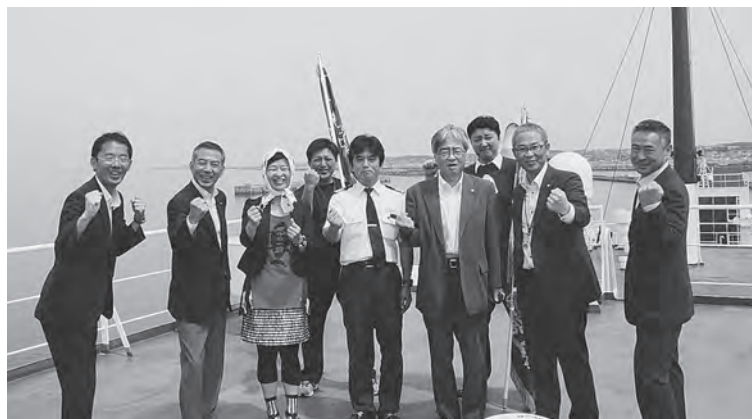
◀大函丸船上で記念撮影