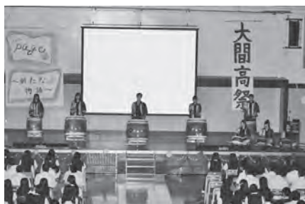
開祭式【津軽海峡海鳴り太鼓】

7月17日（金）～18日（土）の2日間の日程で第41回大間高祭が行われました。今年度は、生徒会役員の積極的な取組により企画内容にも変化が見られ、全員参加型で楽しむように計画がなされていました。開祭式後、クラスCMやクラス対抗間高コンテストなどが行われ生徒は大いに盛り上がり楽しんでいました。二日目は一般公開ということで、保護者や近隣の方々が来校し、クラス展示や模擬店などを見ていただきました。また、PTA母親委員会の協力によりカレーライス販売が行われ生徒も美味しくいただけていました。お母さん方ご協力ありがとうございました。