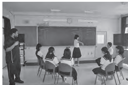
体験学習【ALTによる英会話】