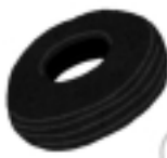
古タイヤなどに溜まった水