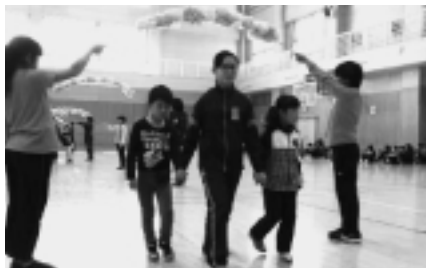
[ちよっぴり緊張してるかな?]

5月2日（火）、「1年生を迎える会」が行われました。1年生が少しでも早く小学校生活に馴染めるようにと、5、6年生の企画委員会が「1年生の自己紹介」や「全校縦割り班を中心としたゲーム」など計画し、2年生以上の子供たちみんなで会を盛り上げました。たくさんの笑顔があふれるすてきな集会となりました。