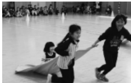
[しっかりつかまっていますね!]