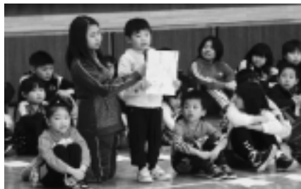
[自己紹介 がんばりました!]