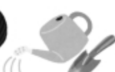
雨ざらしの用具に溜まった水