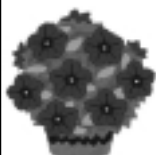
植木鉢の皿に溜まった水