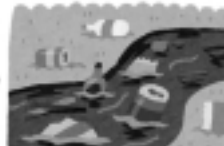
外に放置された空き缶・空き瓶・ペットボトルに溜まった水