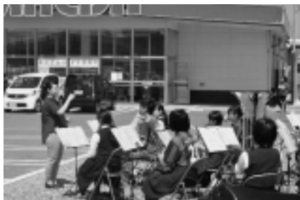
PR隊による宣伝活動

7月13日(木)・15日(土)の二日間、第43回大間高祭が行われました。今年度は一般公開を前にPR隊を組織し、グリーンストアから宮野製パン前の通りとマエダ駐車場で大間高音頭の踊りと吹奏楽部の演奏でPR活動を行いました。1日目の開祭式では、生徒会企画によるコンテストやクラス対抗ゲームで盛り上がりを見せました。2日目は一般公開で、250名以上の保護者や小中学生、近隣の方々が来校し、クラス展示・模擬店、琴・ピアノの演奏などを見ていただきました。また、PTA母親委員会の協力によりくるくるお好み焼き販売が行われ生徒も美味しくいただけていました。ご来校くださいました皆様ありがとうございました。