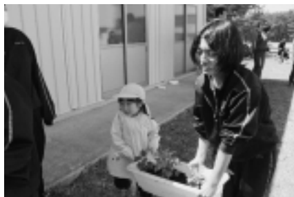
完成したプランターを運ぶ