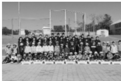
大間小学校へ贈呈