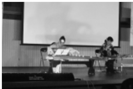
郷土芸能ステージ