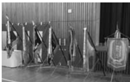
【今年度獲得した優勝旗やカップの数々】

学校行事ばかりでなく、部活動でも多くの成果を残した令和元年度の大間中学校。その活躍の中心となったのが3年生でした。