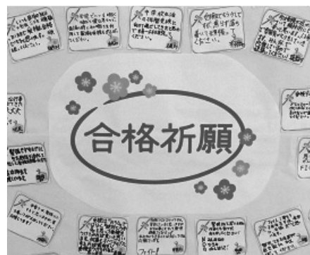
【卒業生へ受検応援メッセージ】

学校行事ばかりでなく、部活動でも多くの成果を残した令和元年度の大間中学校。その活躍の中心となったのが3年生でした。