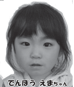
でんぼう えまちゃん

上の段4名は3歳、下の段4名は2歳（いずれも健診日の年齢） これからもしっかりとみがきしよう！