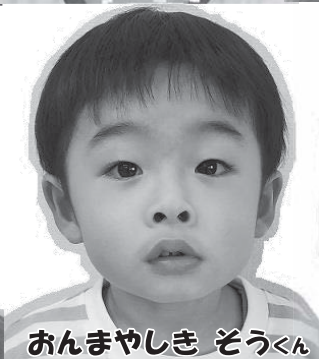
おんまやしき そうくん