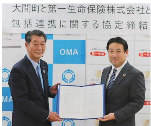
▲左 大間町長 右 第一生命保険(株)青森支社長

包括連携の締結にあたり、町長は「笑顔溢れる町づくりのため、健康面や色々な町民へのサービスに協力していただき、どうしたら町民に笑顔になってもらえるかを考え、一緒に町を明るくしていきたいと思っています。」と述べました。