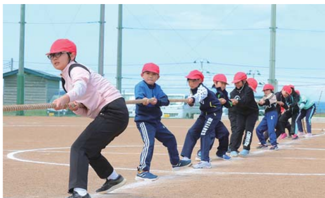
▲奥戸小学校 綱引き

また、今年度は新型コロナ緩和により、子どもたちを応援する声や笑い声が会場を包むような運動会になり、以前の活気に溢れた運動会が返ってきました。