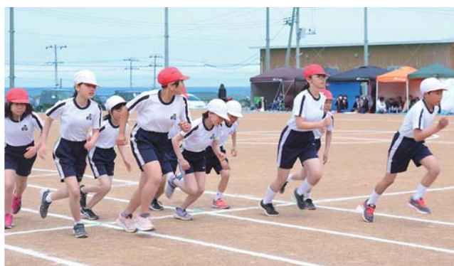
▲奥戸小学校 持久走