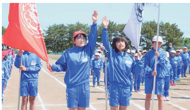
▲大間小学校 選手宣誓