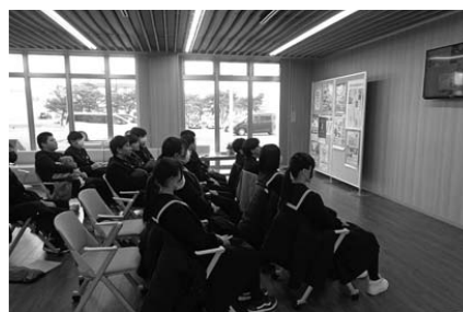
町民ホールの様子