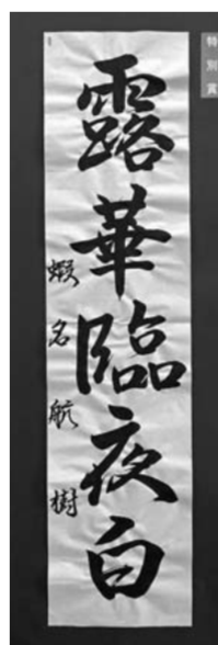
特別賞 蝦名 航樹 (大間高2年)