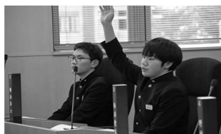
▲三重議員・傳法議員