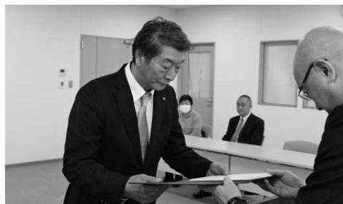
▲当選証書付与の様子