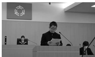
▲演台での一般質問