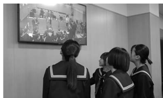
▲議場見学(の様子を見学！)