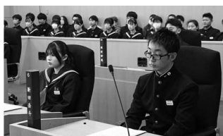
▲南議員・新田議員