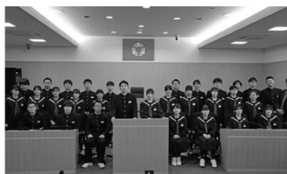
▲議場にて記念撮影